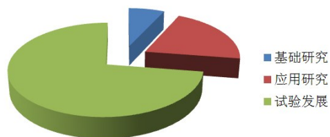
2015年自治区从事研究与试验发展（R&D）活动经费支出构成