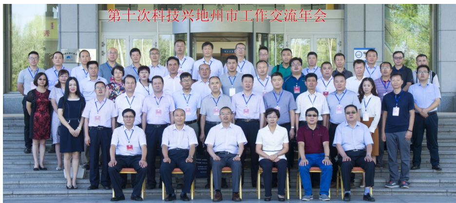
第十次科技兴地州市工作交流年会

发挥《新疆科技报》汉、维、哈三种语言文字科技主流媒体作用，报纸发量覆盖全疆每一个乡村。主办的新疆科技微信平台全年发表230期，发布图文信息920条，推送280万人次。完成《新疆科技动态》30期、《科技兴新简报》5期。