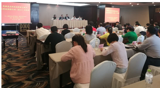
2017年新疆基层科技创新能力提升与科技维稳行动(浙江)培训班在杭州开幕。